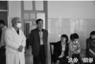
苏健全与接种甲型H1N1流感疫苗学生交谈

本报讯 (记者 戴静)11月3日上午,湘潭市副市长苏健全到我校检查甲型H1N1流感疫情防控工作,并到医务所现场了解甲型H1N1流感疫苗的接种情况。岳塘区区长、市卫生局局长及市、区疾控中心等部门相关人员随行。我校副校长彭晓接待了检查组。