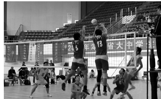
11月7日，中南大学和湖南师范大学男子组排球队上演了2012年大中学生排球比赛的巅峰对决之战

学生排球比赛桂冠；中南大学则囊括大学男子、女子组亚军；南华大学女子组、湖南工业大学男子组今年第一次参赛便分别荣获大学女子组及男子组季军；周南中学将中学男子组、女子组桂冠收入囊中，知源中学则荣获中学男子组第二名的好成绩，安乡一中获得中学女子组第二名。另外，高职专科