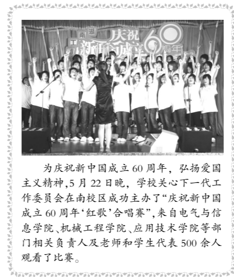
为庆祝新中国成立60周年,弘扬爱国主义精神,5月22日晚,学校关心下一代工作委员会在南校区成功主办了“庆祝新中国成立60周年‘红歌’合唱赛”,来自电气与信息学院、机械工程学院、应用技术学院等部门相关负责人及老师和学生代表500余人观看了比赛。

中谈到:湘潭的高校队伍在不断壮大,湘潭高校在湘潭具有极为重要的地位,是湘潭的一个亮点,发展湘潭的高校是市委、市政府对湘潭发展做出的重大策划。针对全市大学生思想政治教育工作,周巧艺提出了三点意见,一要把社会主义核心价值观教育融入到大学生思想政治工作中去。要坚持“以人为本”,切实提高大学生思想道德水平,坚持把社会主义核心价值观体系融入到课堂教学,充分发挥课堂教育的主渠道作用,做到“入耳、入脑、入心”;坚持把社会主义核心价值观体系融入到校园文化建设中;坚持把社会主义核心价值观体系融入到大学生社会实践活动中;坚持把社会主义核心价值观体系融入到大学生思想和日常行为管理中;坚持把社会主义核心价值观体系融入到师德师风建设中。二要切实围绕大学生的就业、创业开展思想政治教育工作。对大学生进行就业、创业形势教育,努力把困难讲清楚,把前景讲明白,把握好就业政策,提振大学生的就业信心;组织大学生就业、创业典型的宣传,树立标杆,激励大学生面对现实