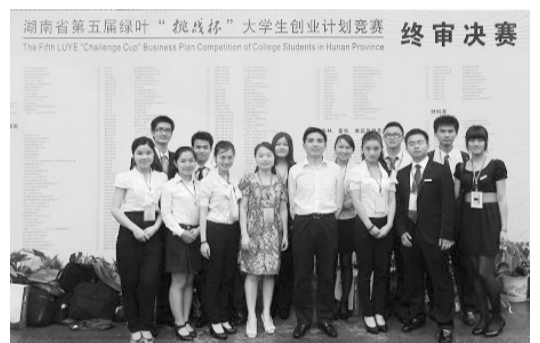
湖工学子喜获省“挑战杯”创业计划竞赛金奖