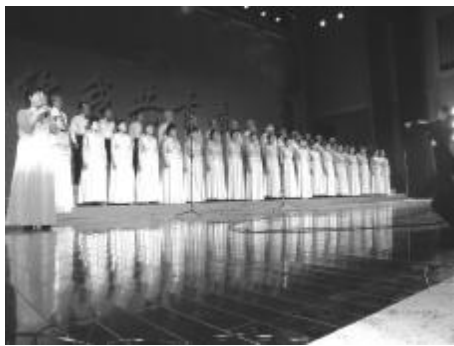
我校“夕阳红”合唱团在表演精彩节目